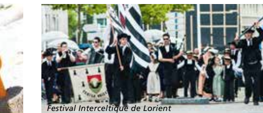
Festival Interceltique de Lorient