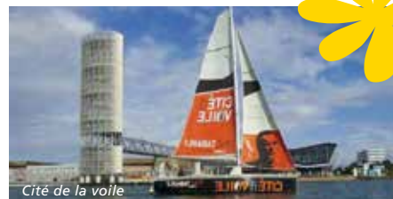
Cité de la voile