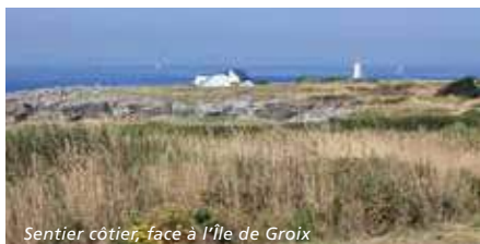
Sentier côtier, face à l'Île de Groix